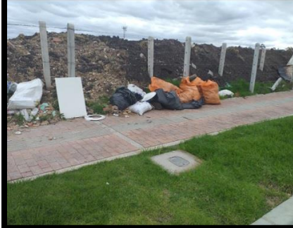
• Vía Local 6.