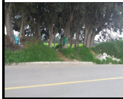
• Carrera 25 entre calles 6 sur y 7 sur.