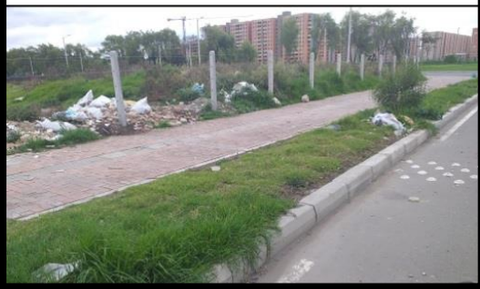
• Carrera 24 entre calles 6 sur y 7 sur.