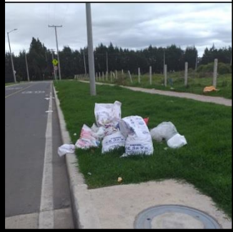
Calle 6 Sur # 24-127.