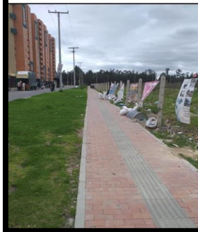
Calle 6 Sur # 24-57.