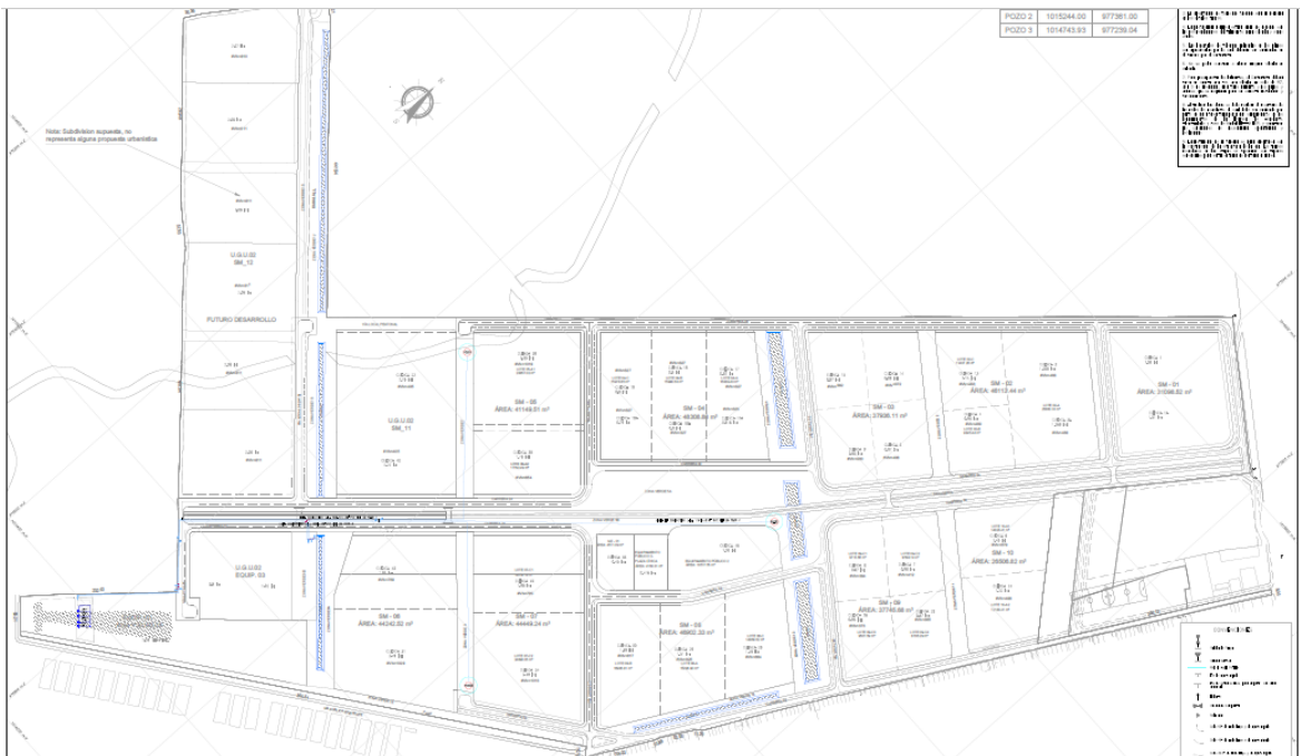
Ilustración 2 Vista del área de expansión urbana de prestación del servicio Aguas de La Prosperidad.